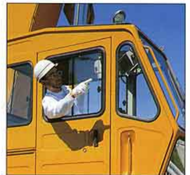
●窓から顔が出せる「コミュニケーションウィンド」を採用。