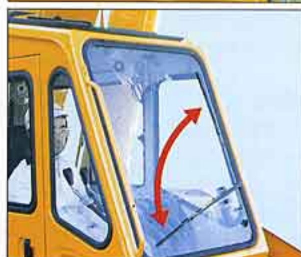
●水はけの良くなったウォッシャ付前面ワイパーと高所作業時のクリアな視界を確保する、ウォッシャ付天井ワイパー。