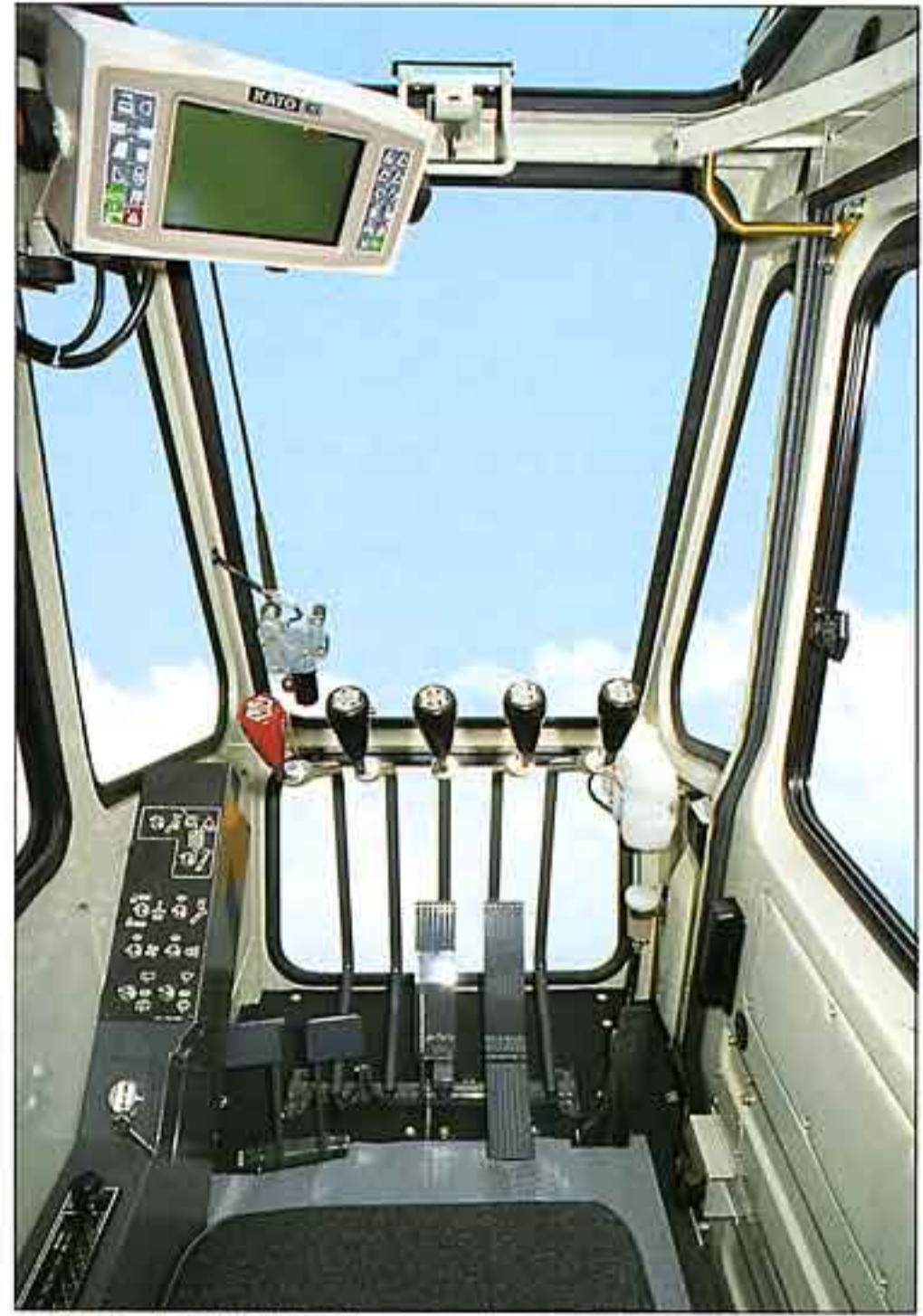
●ゆったりと広い居住空間を確保、シックでゴージャスな機能的キャブ。

●小雨時に便利なウォッシャ付大型ワイパーを採用。さらに、大型ルーフウィンドウにもウォッシャ付の強力なワイパーを装備、高所作業時のクリアな視界が確保されています。