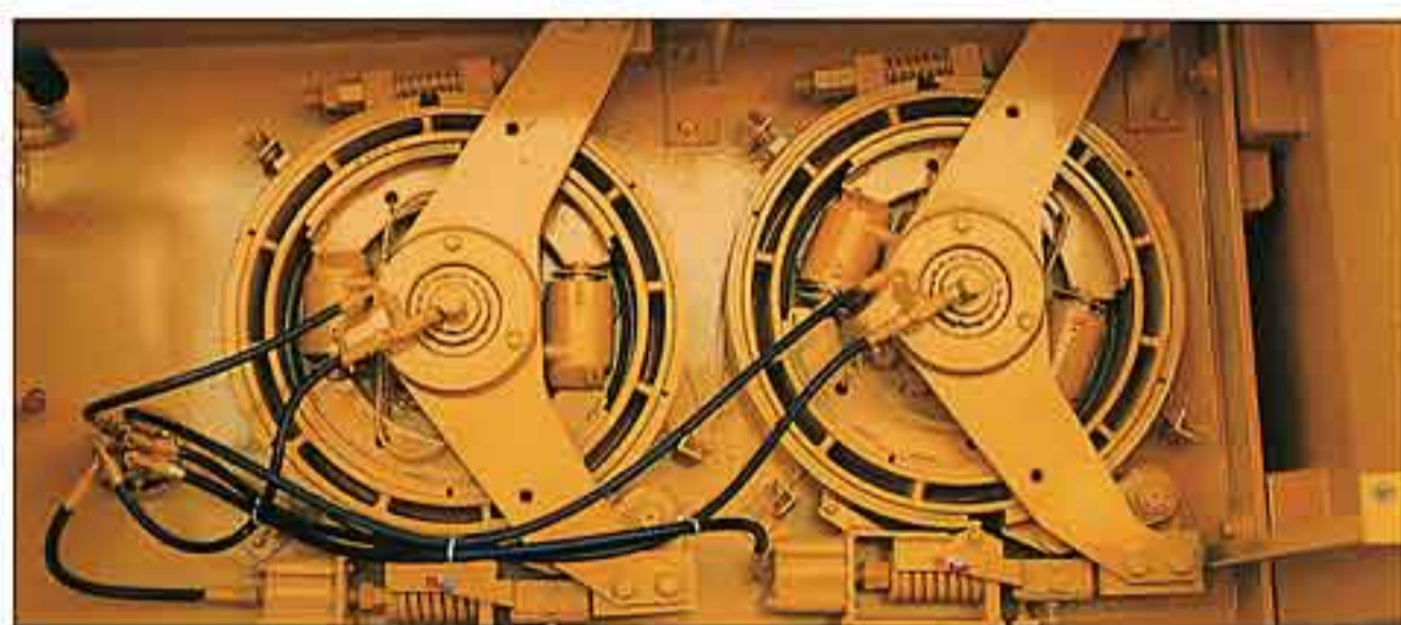
●スピーディな複合操作ができる、強力なウインチ機構。