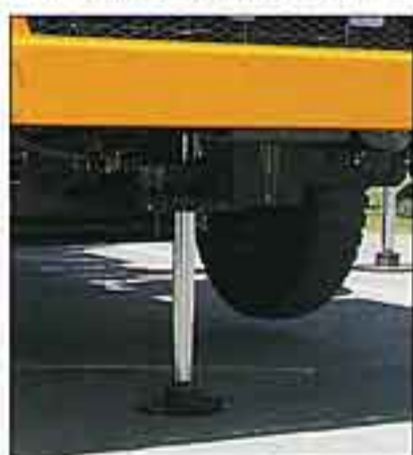
広い全周同一吊り上げ性能を発揮する油圧式フロントジャッキ