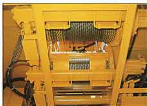
●ロープ乱巻防止装置付ドラム。