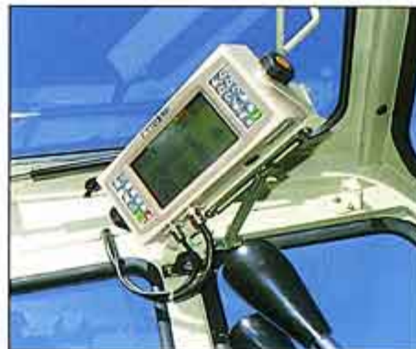
●正確に作業状態を把握する、作業範囲制限機能付マルチビジョン。