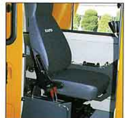
●座り心地が良く、ホールド性に優れた、ファブリッククライニングシート。