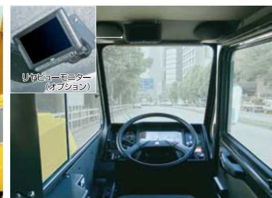
▲走行時の視界も良好・キャリヤキャブ