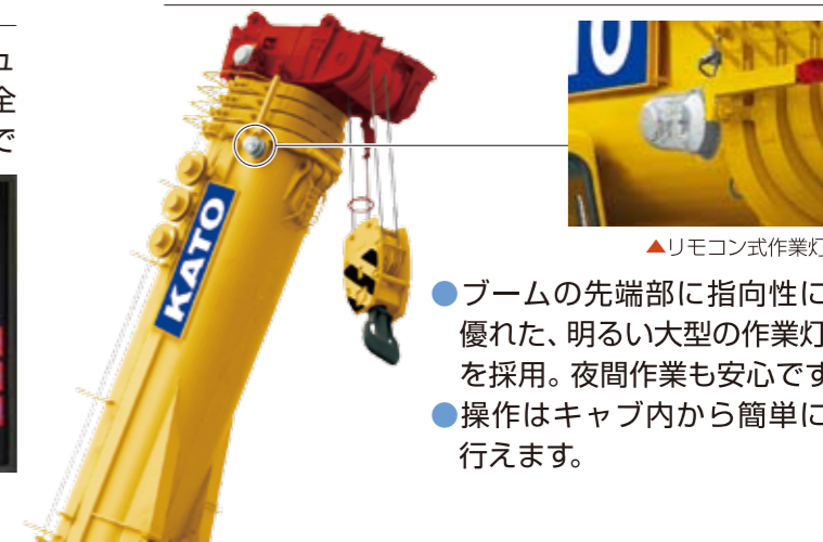
▲リモコン式作業灯